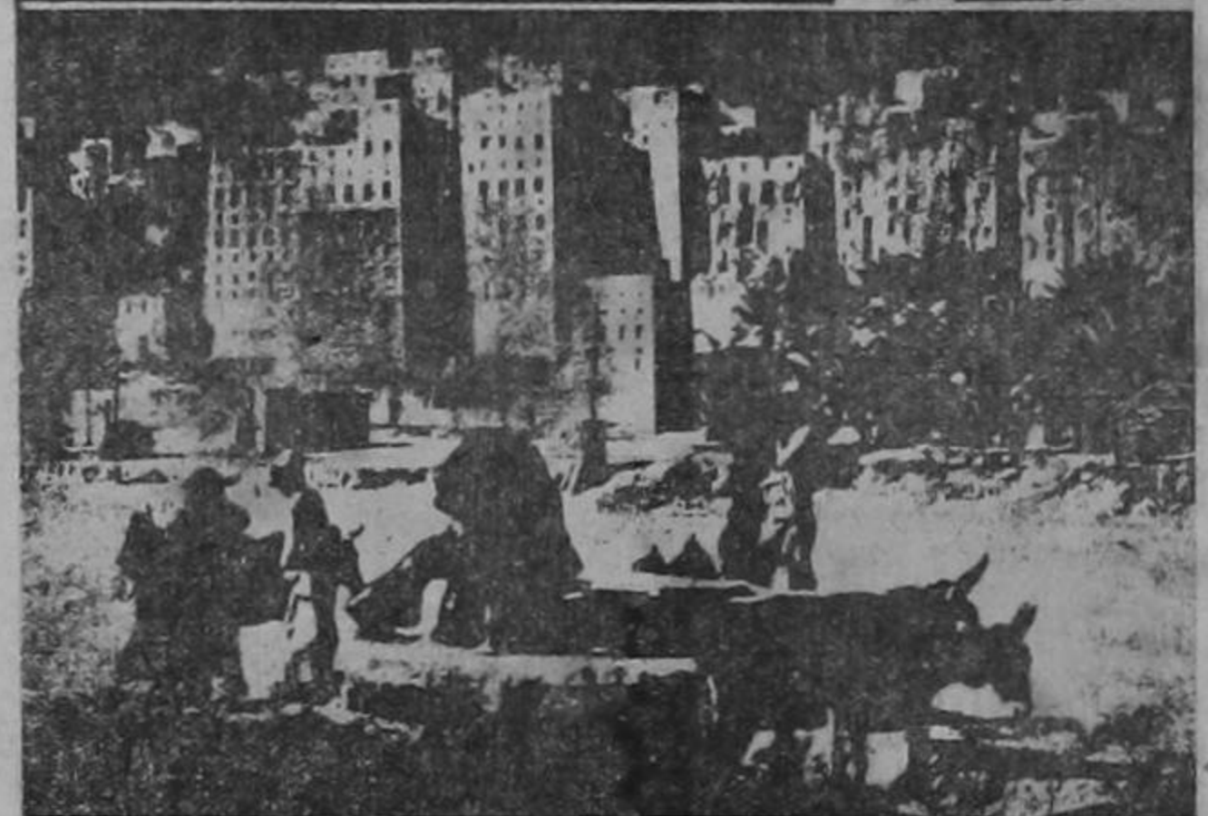
Arriba: mapa que muestra la aspiración inmediata de Ibn Saud. —Abajo: Sheban, la Chicago del Des'erto